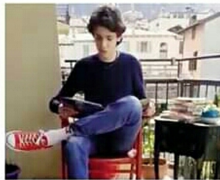
Anche i ragazzi hanno mandato video e fotografie